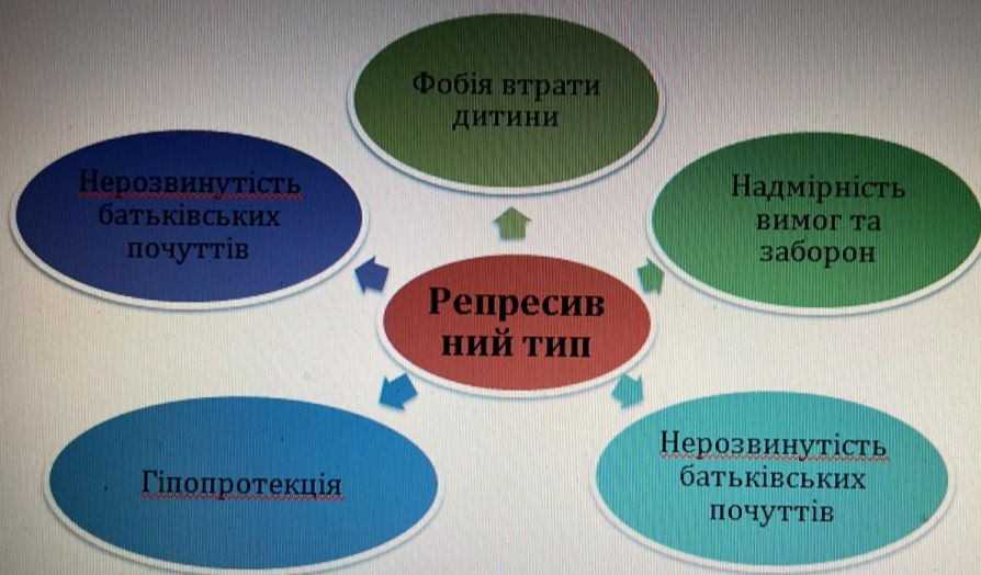
Рис. 7. Значущі позитивні кореляції між Репресивним типом та шкалами БОД Демократичний тип обернено пов'язаний із "Гіпопротекцією",