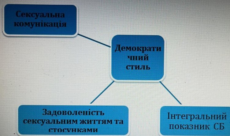
Рис. 4. Міжфункціональні взаємозв'язки Демократичного стилю статевого виховання і показників сексуального благополуччя

Досліджувані, у чий сім'ї переважає нав'язливий тип статевого