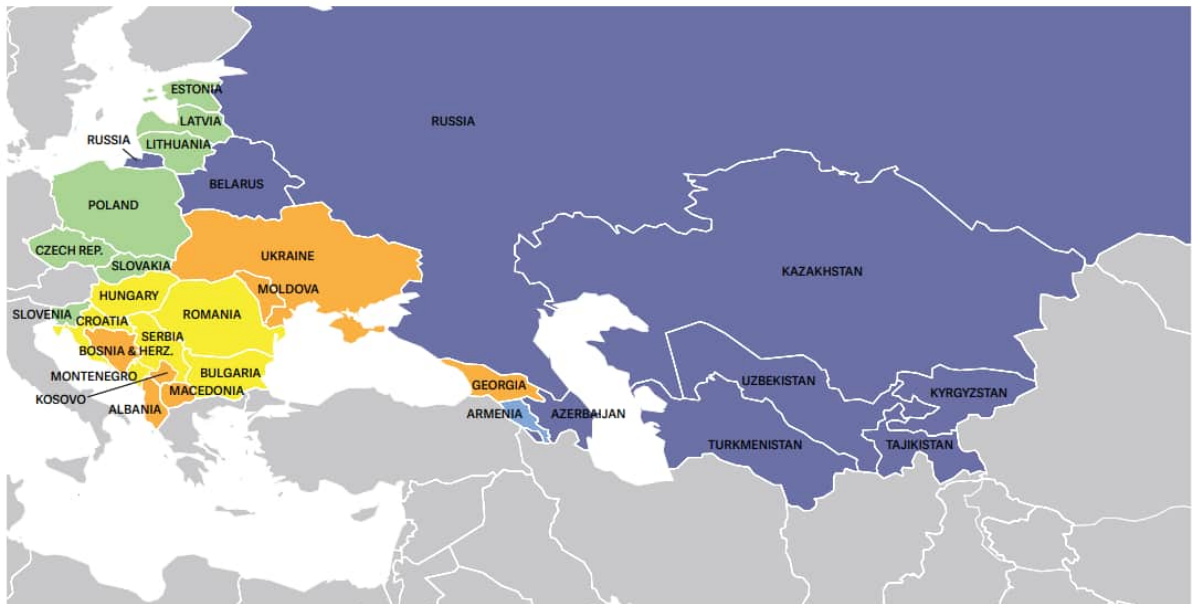
NATIONS IN TRANSIT 2018