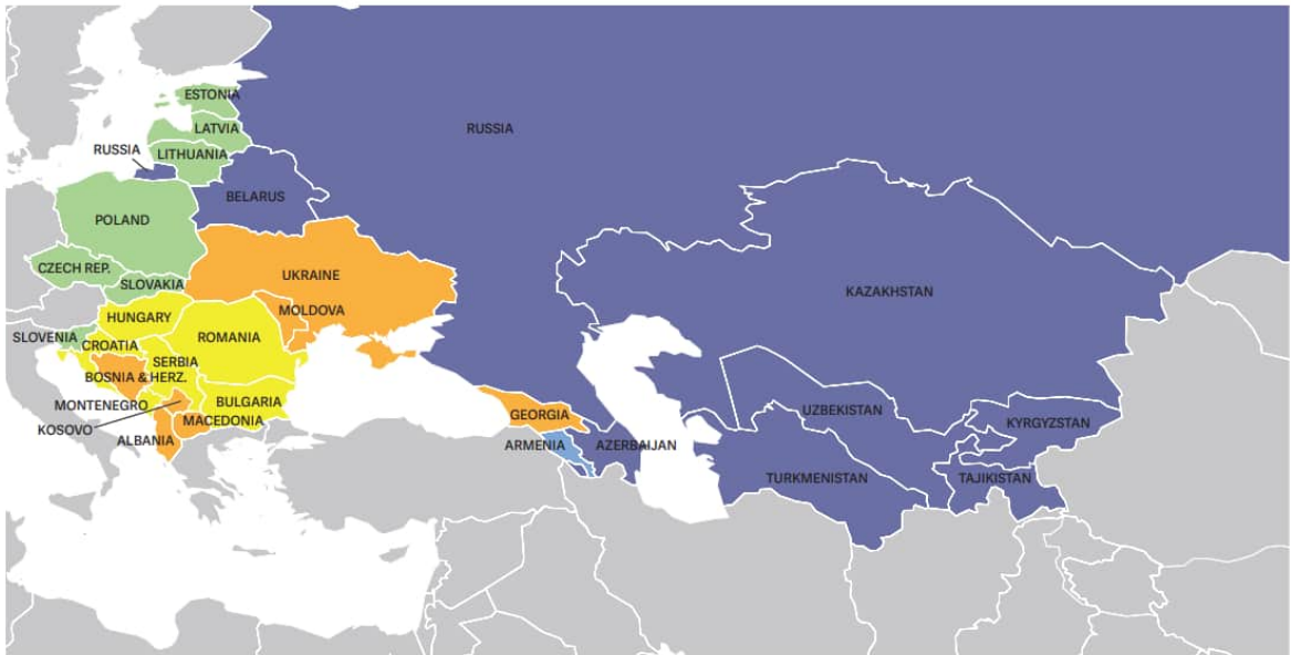
NATIONS IN TRANSIT 2017