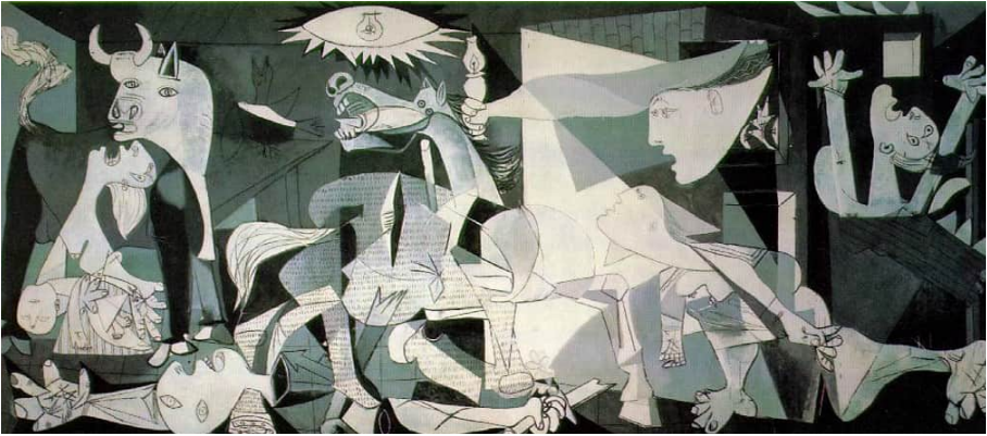
Пабло Пікассо. «Герніка»

Оце і є абсурд, про який ти питаєш, мовляв, як він виглядає. Розумні люди у світі, де панують закони природи, юридичні норми, моральні настанови, чинять жахливі речі, ніби вони втратили розум. Зауваж: абсурдним є не світ сам собою, а вчинки людей, які – увага! – насправді розуму не позбулися. Усе, що вони чинять, є наперед обміркованим, обрахованим, але наслідки цих дій виявляються зовсім не такі, які мали б статися за цими розрахунками. Це і є причиною того, що філософи втратили довіру до розуму: розум нікуди не дівся, але він не розв’язує наших проблем, а лише породжує нові й нові.