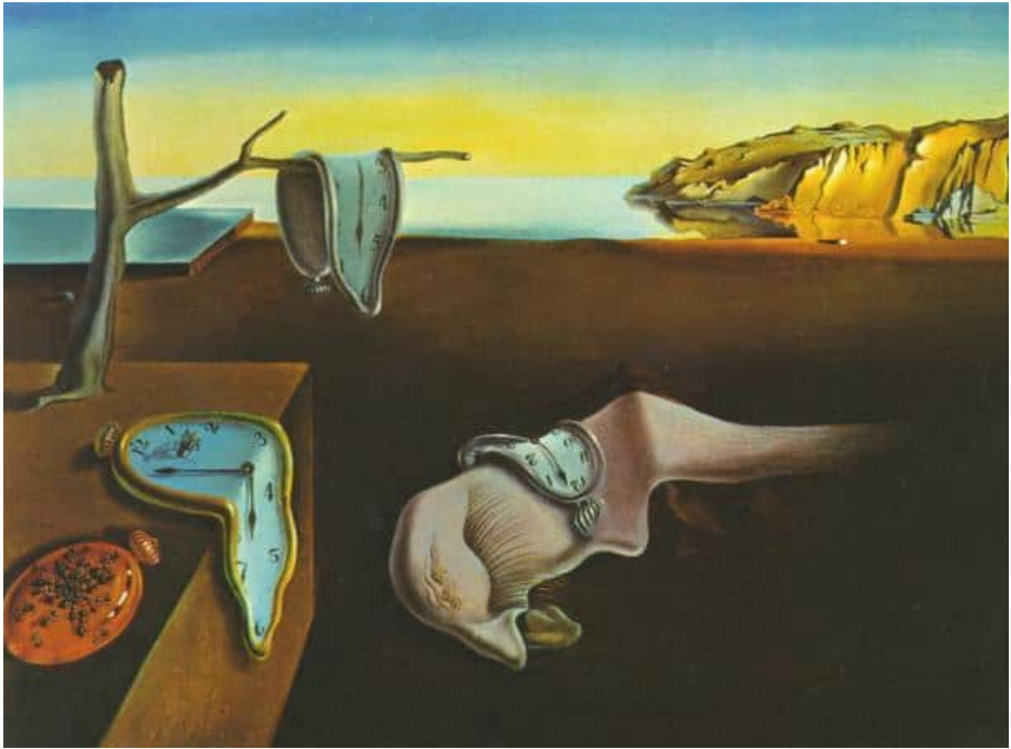
Сальвадор Далі. «Постійність пам'яті»

Особливо промовистий сюжет картини «Постійність пам'яті», написаної Сальвадором Далі через два десятиліття після Мунківського «Крику». Годинники більше не показують час – час спинився. Більше вже нічого не відбудеться. Світ зруйновано.