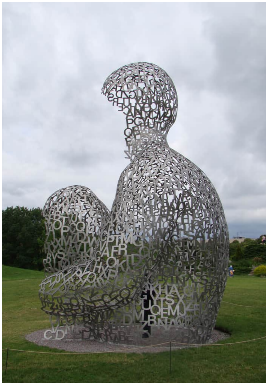
Жауме Пленса. «Дім знань»