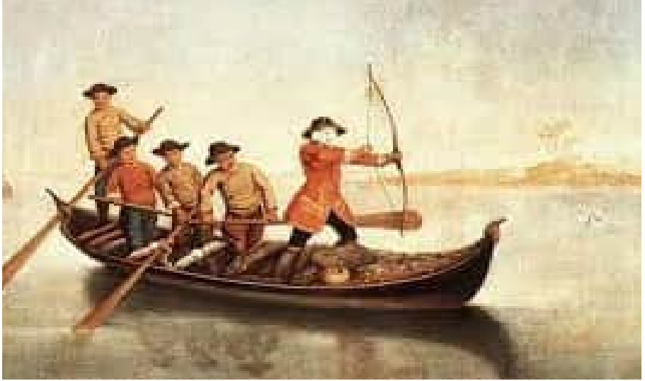
П'єтро Лонгі. «Полювання на качок»