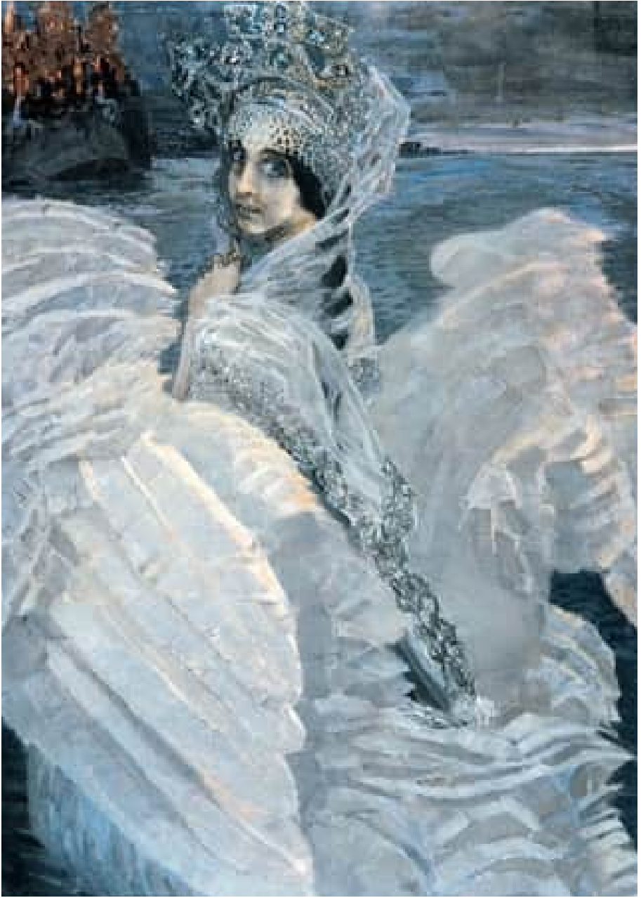
Михайло Врубель. «Царівна-лебідь»