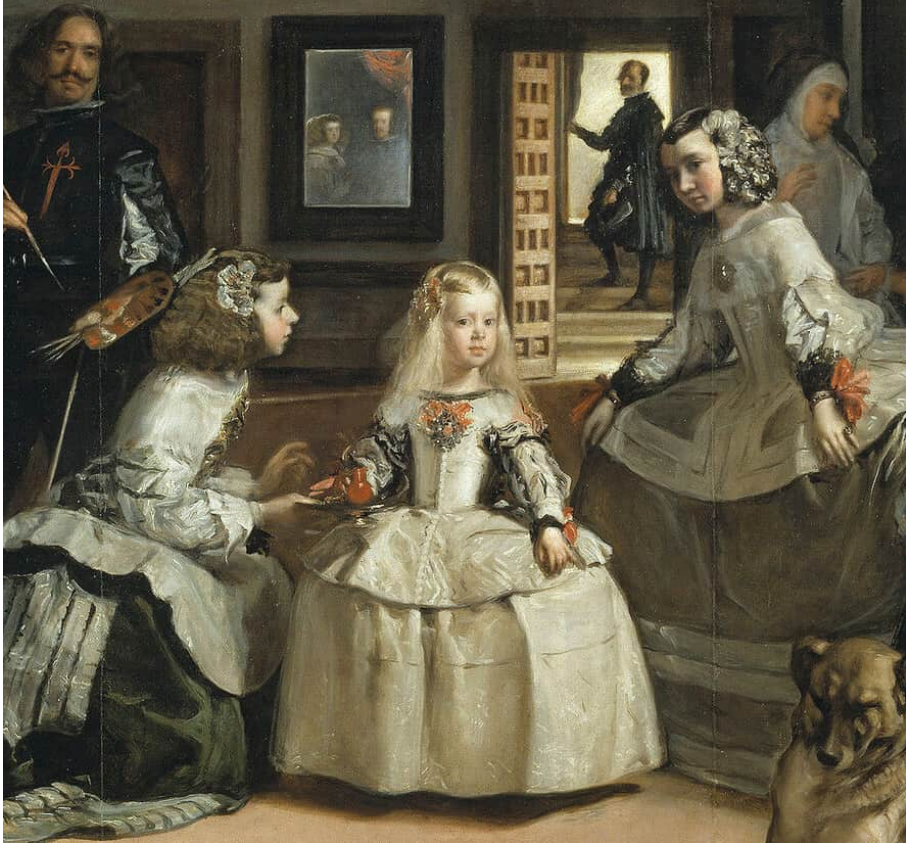
Дієго Веласкес. «Фрейліни»