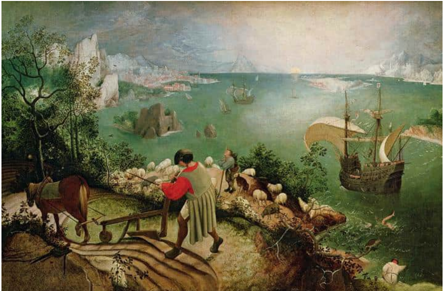
Пітер Брейгель старший. «Падіння Ікара»