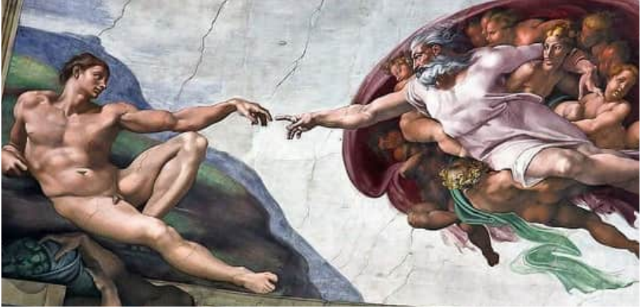
Мікеланджело Буонаротті. «Створення світу». Фрагмент