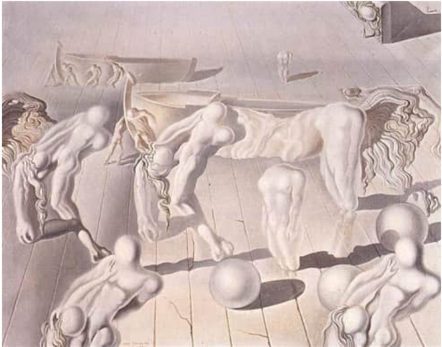
Сальвадор Далі. «Невидима спляча жінка, кінь, лев»