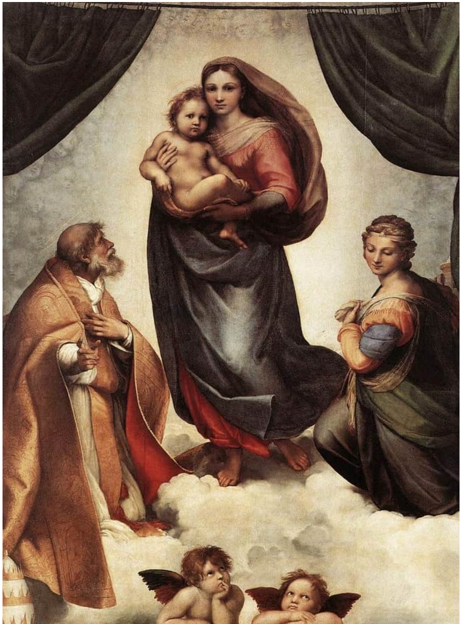
Рафаель Санті. «Сікстинська мадонна»