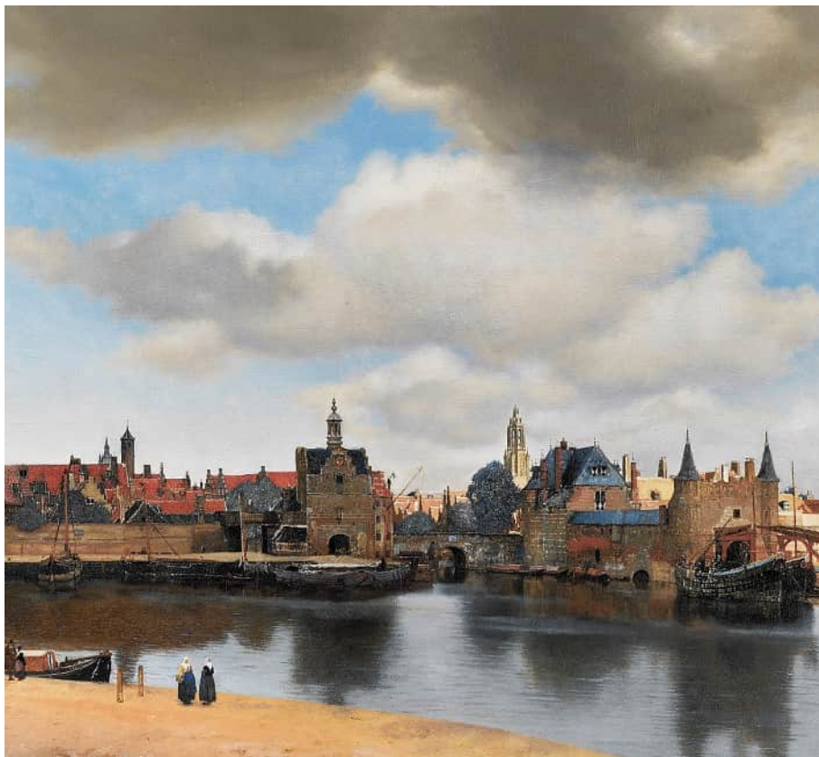
Ян Вермер Дельфтський. «Вид Дельфта»