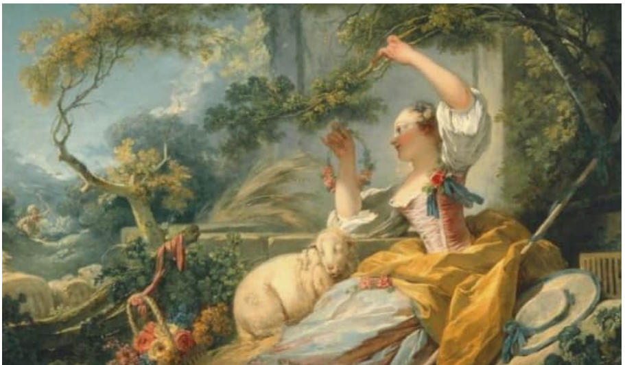
Жан-Оноре Фраґонар. «Пастушки»