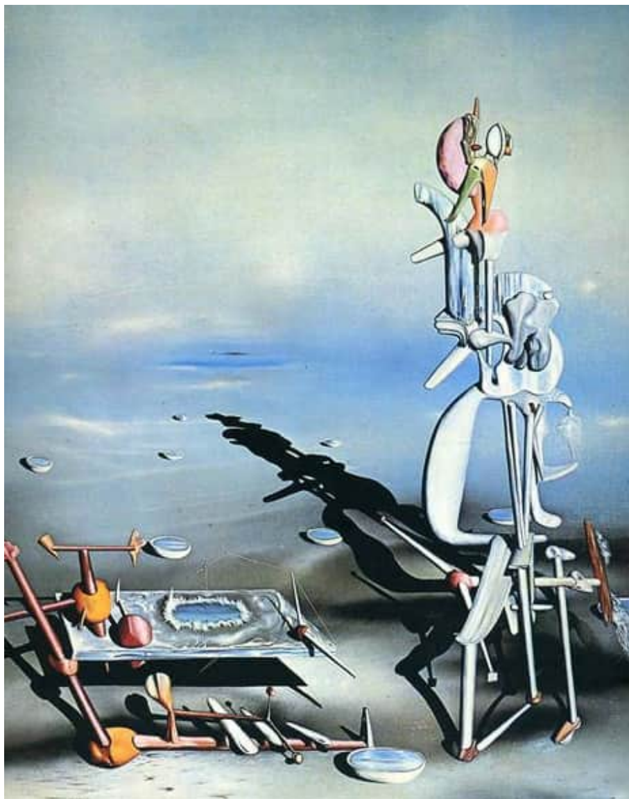
Ів Тангі. «Перевтілення»

Це Сальвадор Далі. І це все, що залишилося від прегарної картини світу минулих часів. Безформні руїни, які колись були людьми, тваринами, морем, можливо, кораблем і ще невідомо чим.