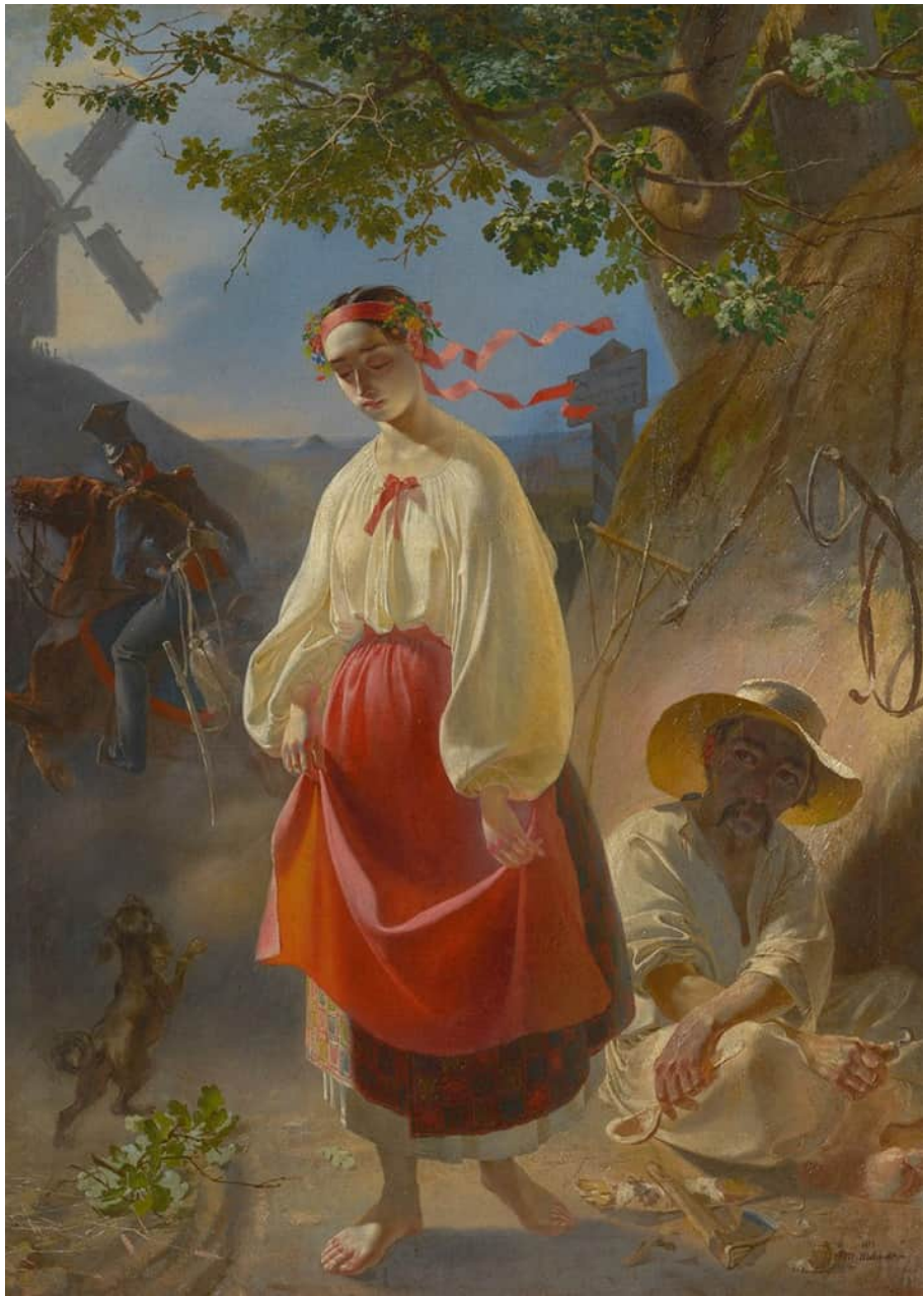
Тарас Шевченко. «Катерина»