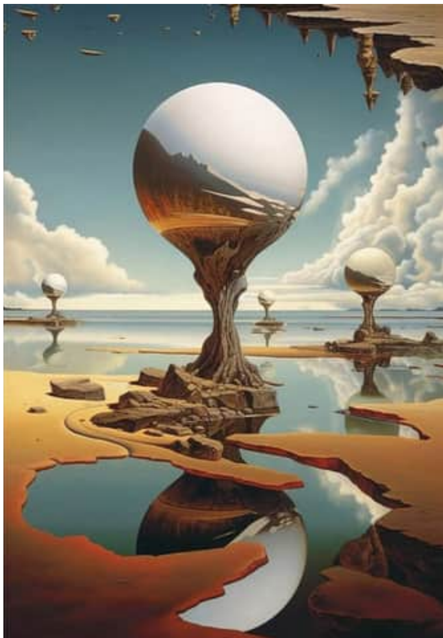
Сальвадор Далі. «Годинник»